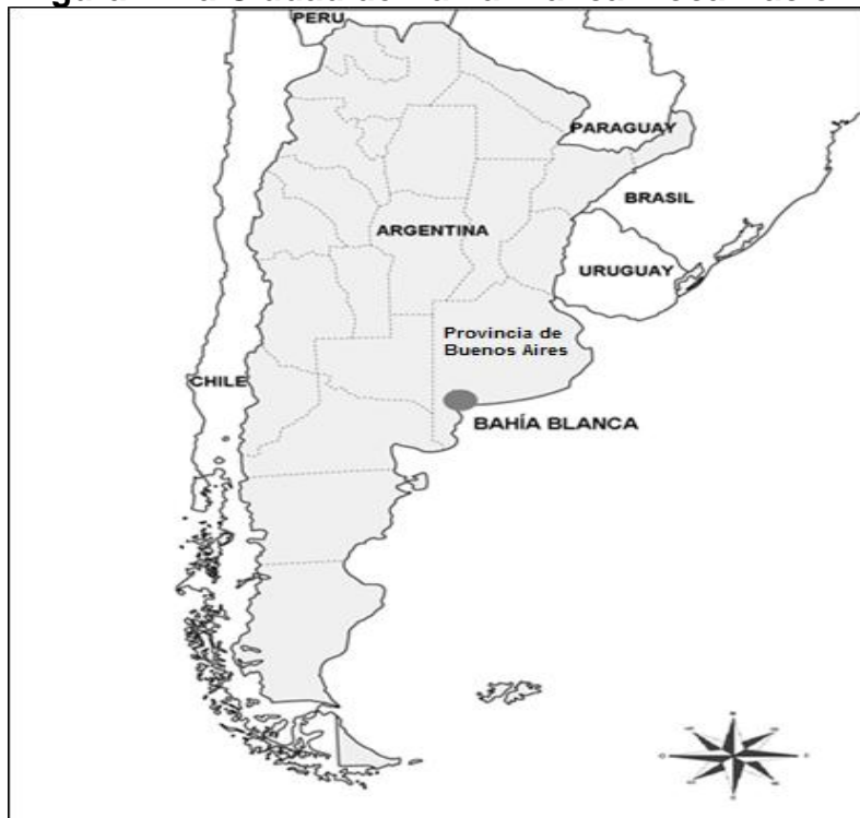
Figura 1. La Ciudad de Bahía Blanca. Localización.

Bahía Blanca es una ciudad intermedia- unos 300.000 habitantes según el Censo de Población del 2010-localizada en el sur de la Provincia de Buenos Aires (Figura 1) 7 . Las funciones de intermediación que ejerce en el territorio son variadas y se encuentran ligadas a su posición geográfica y condición de centro portuario y de transbordo, sumado a la provisión regional de bienes y servicios y su rol como centro político-administrativo (GORENSTEIN et. al., 2012). En ciertos casos, como en salud y educación, opera como un centro regional con alcance territorial que excede a su área próxima de influencia. De este modo, la posición que ocupa en la jerarquía urbana nacional y provincial pone de manifiesto su gravitación territorial (Cuadro 2).